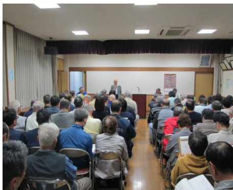
平成31年度滝区総会 4/21