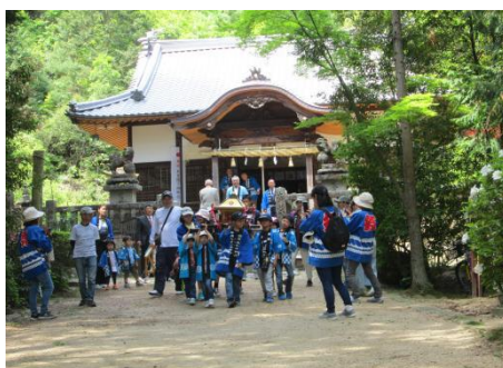
“わっしょい” 御輿を担いで渡御開始