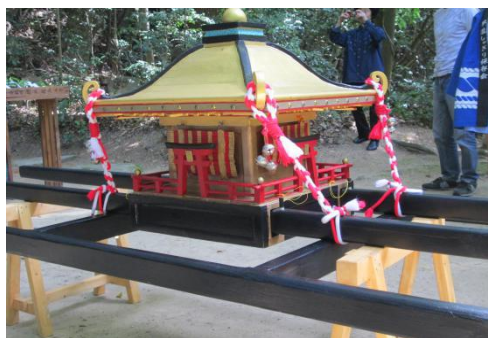
新しくなった子ども神輿「小槇氏作」 5/5