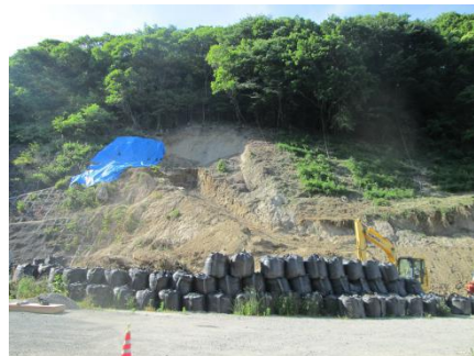
県道62号線崩落ヶ所工事開始 5/10