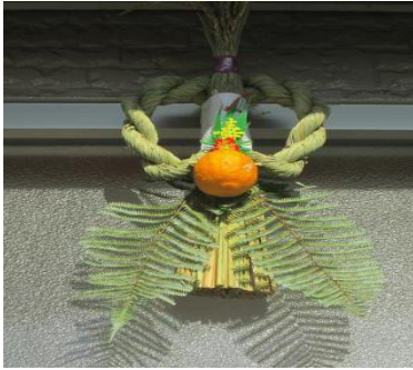
しめ縄平松孝義氏作