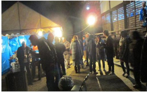
元旦祭 (早滝比咩神社境内)