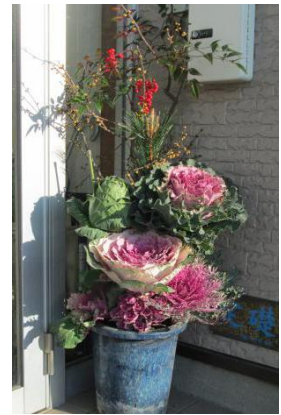
正月飾り平松養子氏作