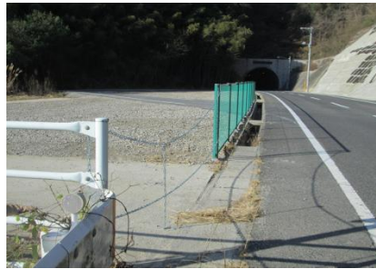
トンネル崩落ヶ所フェンス設置