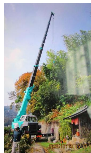
右の脇架け台木の伐採