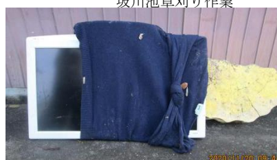
不法投棄テレビ・木片