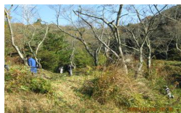
坂川池草刈り作業