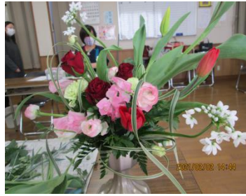
フラワーサークル教室