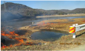
三堀池内草焼却作業