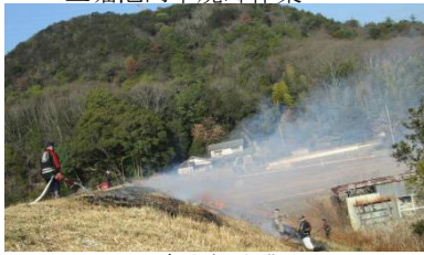
三堀池提塘焼却作業