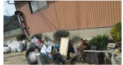
回収された不法投棄（ゴミ）