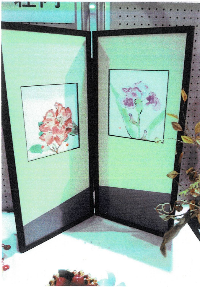
衝立 依田 清